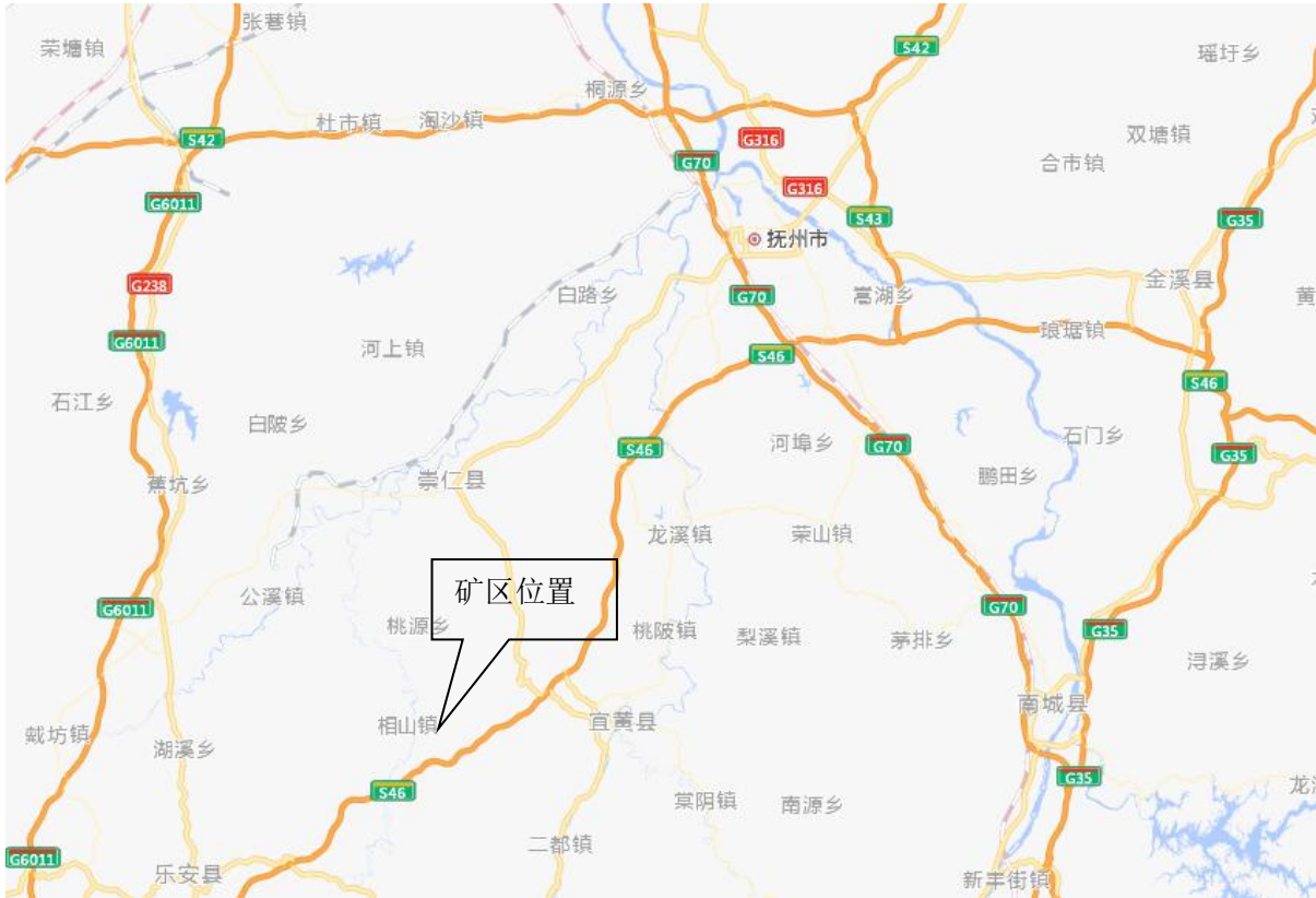
图 2-1 交通位置图