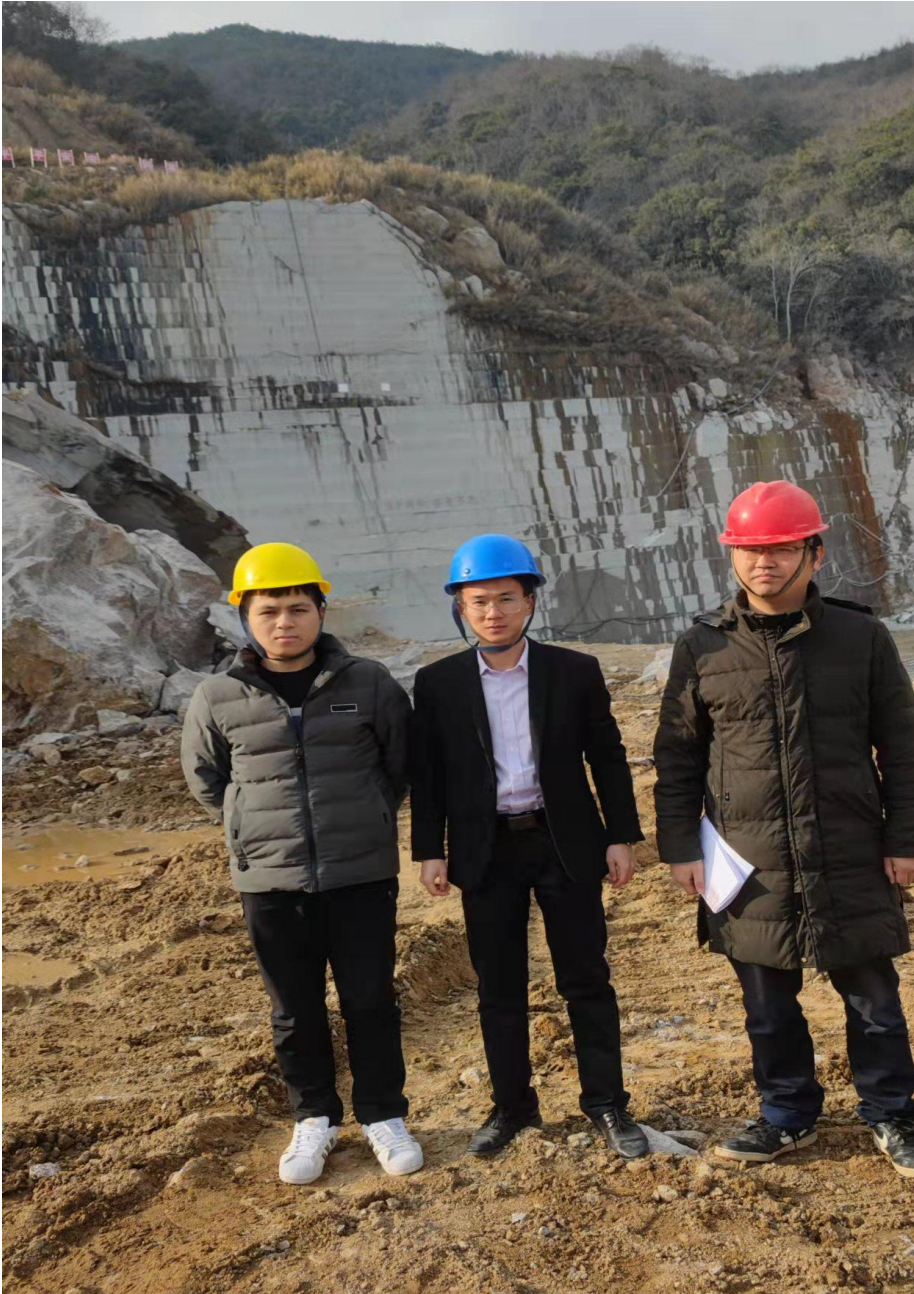
评价人员现场照片