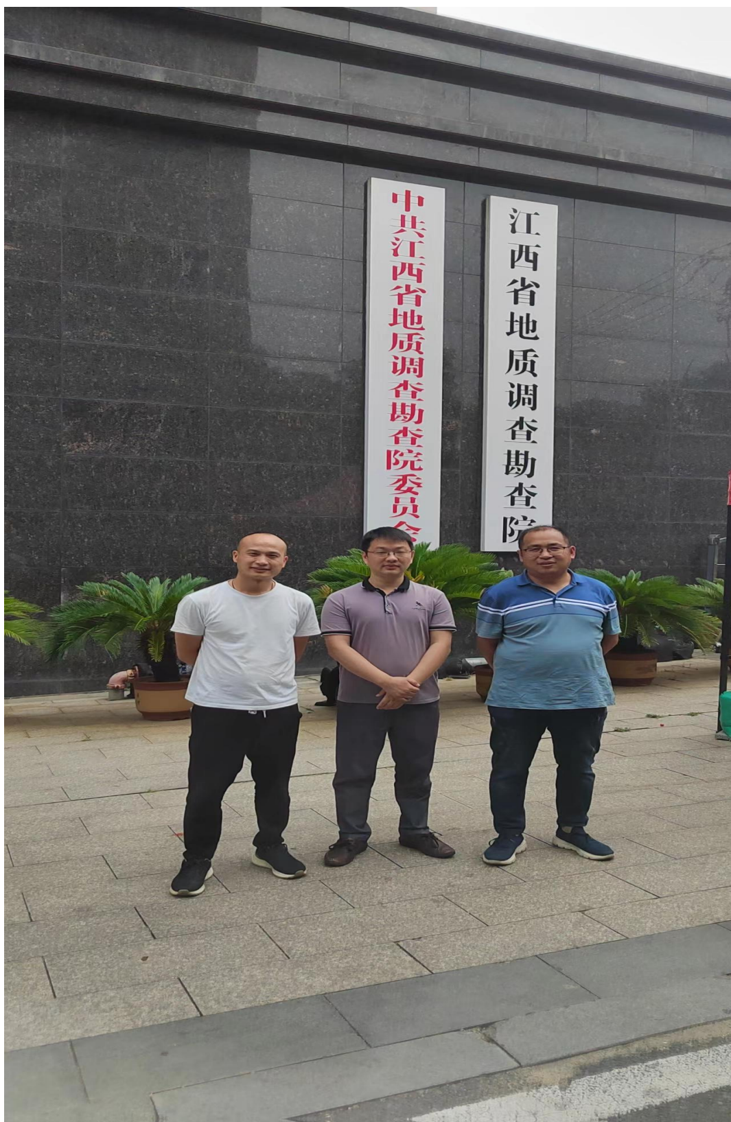
与江西省地质调查勘查院安全管理人员合影