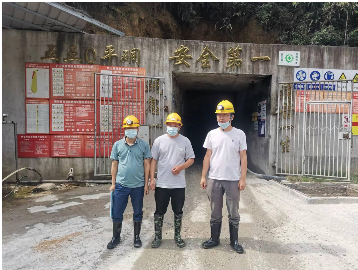
评价人员与企业管理人员合影